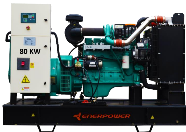
GRUPO ELECTRÓGENO ABIERTO