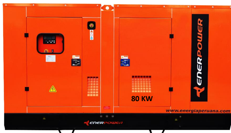
GRUPO ELECTRÓGENO ENCAPSULADO