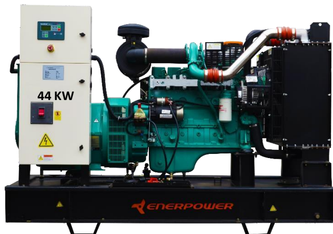
GRUPO ELECTRÓGENO ABIERTO