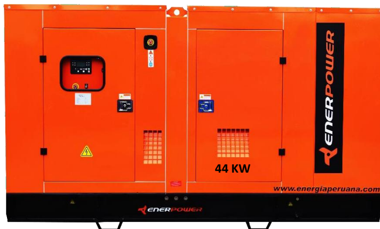
GRUPO ELECTRÓGENO ENCAPSULADO