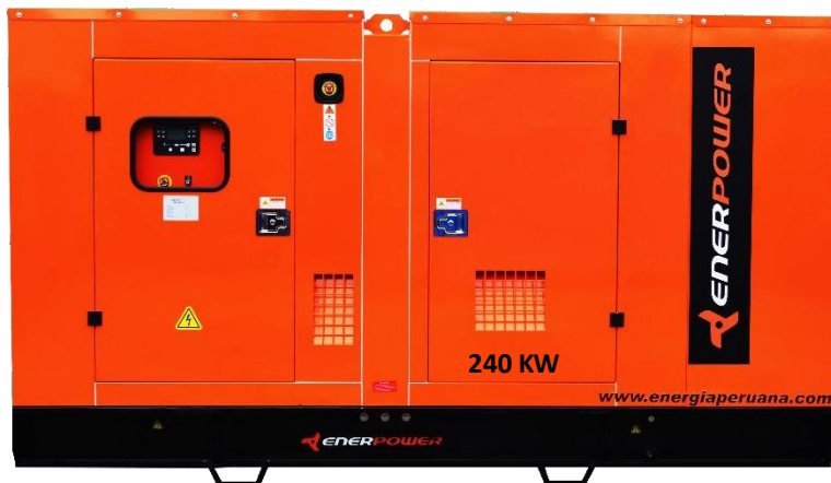
GRUPO ELECTRÓGENO ENCAPSULADO