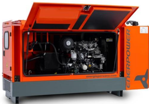
GRUPO ELECTRÓGENO INSONORIZADO