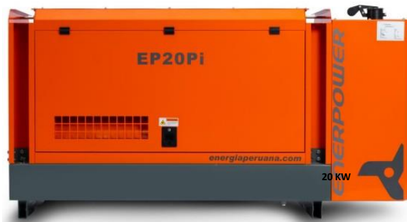
GRUPO ELECTRÓGENO INSONORIZADO