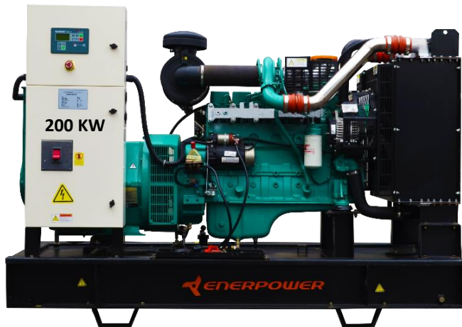
GRUPO ELECTRÓGENO ABIERTO