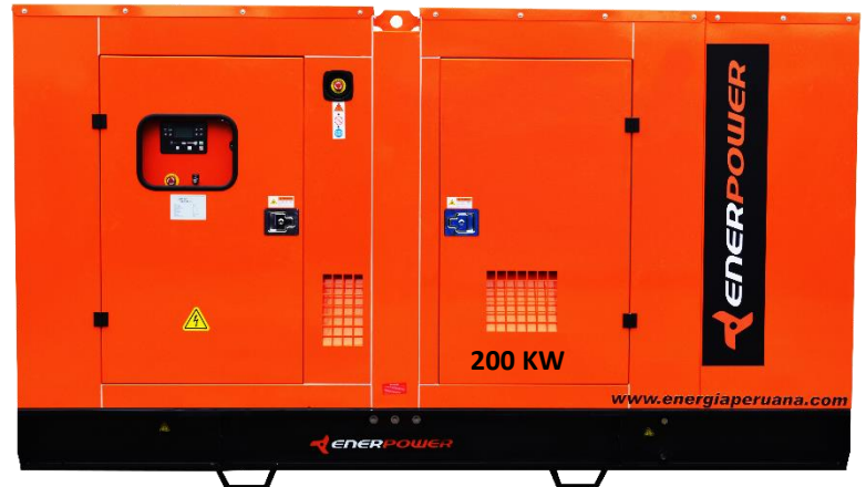
GRUPO ELECTRÓGENO ENCAPSULADO