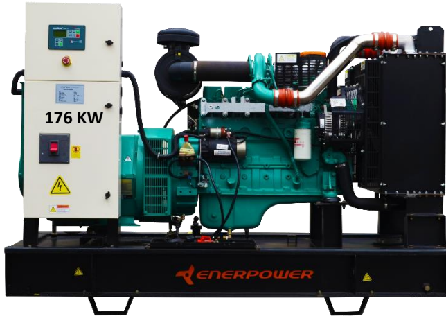
GRUPO ELECTRÓGENO ABIERTO