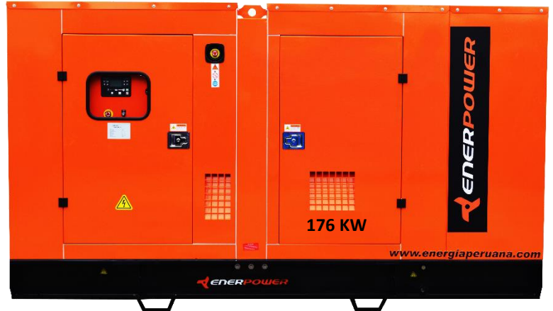
GRUPO ELECTRÓGENO ENCAPSULADO