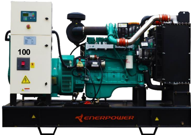
GRUPO ELECTRÓGENO ABIERTO