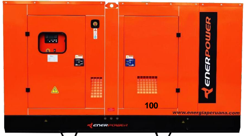
GRUPO ELECTRÓGENO ENCAPSULADO