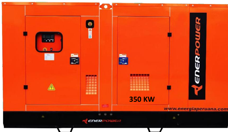
GRUPO ELECTRÓGENO ENCAPSULADO