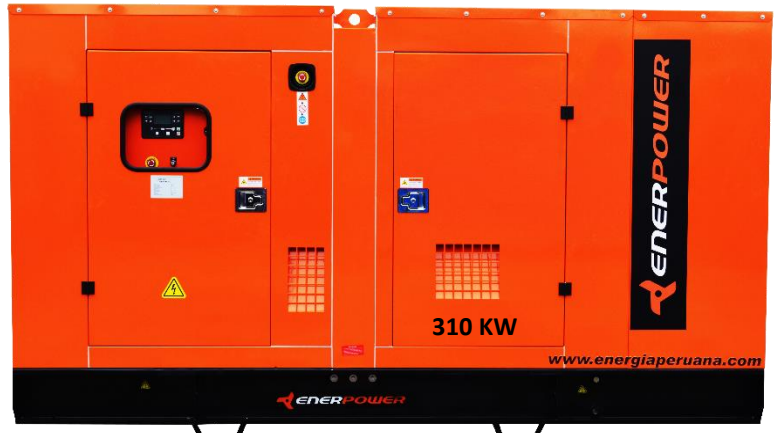
GRUPO ELECTRÓGENO ENCAPSULADO