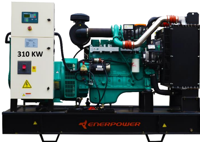
GRUPO ELECTRÓGENO ABIERTO