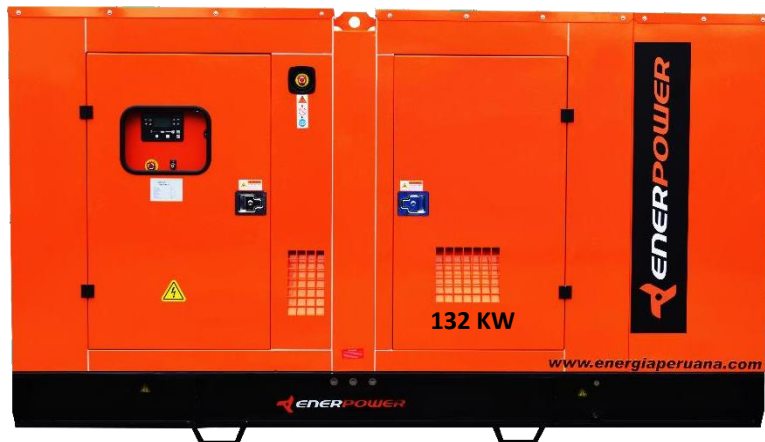
GRUPO ELECTRÓGENO ENCAPSULADO