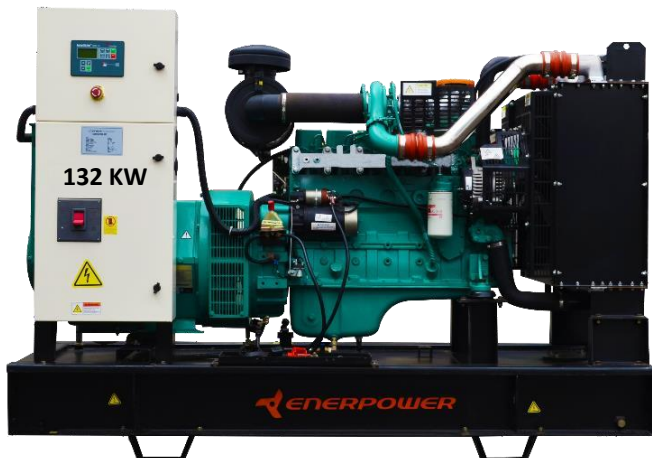
GRUPO ELECTRÓGENO ABIERTO